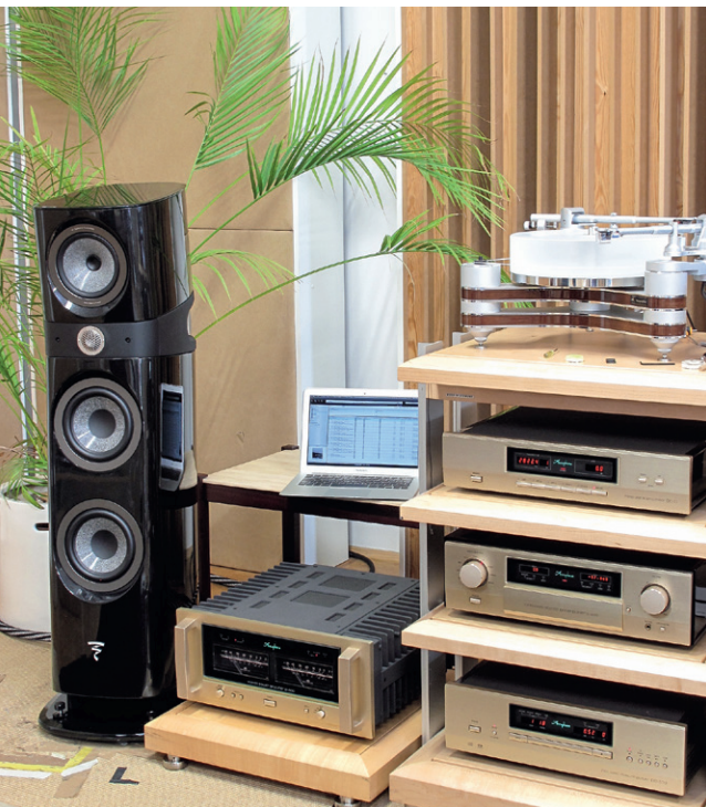
▲ Unter anderem betrieben wir den DC-37 in einer kompletten Accuphase-Kette samt des Super-Pres C-3800 (M.).

Denn um die Vorzüge des DC-37 zu erleben, braucht's kein Hochbit-PCM oder Doppel-DSD. Mit ihm kann der anspruchsvolle Hörer seine gesamte CD-Sammlung neu entdecken. Dabei fügt er sich klanglich wie technisch nahtlos in die Oberliga des Accuphase-Programms ein und wertet womöglich manchen Player der Japaner auf. Und in Verbindung mit einer der beliebten Bridge-Lösungen fürs Heimnetzwerk würde das Multitalent sogar zum Streamer. Matthias Böde