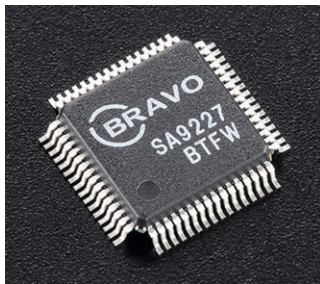
▲ Dieser kleine Vielfüßer organisiert den USB-Eingang des Accuphase für vielfältigste Formate.

Dieses Ergebnis ist keine Selbstverständlichkeit, ist doch auch der DP-550 mit der von diesem Hersteller seit Jahren verfolgten wie verfeinerten „MDS++“-Wandler-technik ausgestattet, bei der Accuphase durch die Kaskadierung mehrerer Konverter-Chips Verzerrungen und Rauschen reduziert. Und natürlich weisen auch die analogen Ausgangsstufen, die das Signal jeweils an einem Paar Cinch- beziehungsweise XLR-Anschlüssen bereitstellen, große Ähnlichkeiten auf. Doch während der DP-550 in seinem „Multiple Delta Sigma“-Array pro Kanal sechs 32-Bit-Chips von ESS Technology verwendet, sind es im DC-37 derer acht, was die Präzision weiter steigern soll. Unser Labor weist Top-Werte aus.