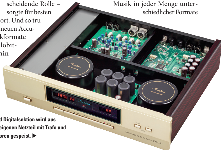
Die Analog- und Digitialsektion wird aus jeweils einem eigenen Netzteil mit Trafo und Siebkondensatoren gespeist. ►

Datentransport. Und so trugen wir dem neuen Accuphase Musikformate von 320-Kilobit-MP3 bis hin