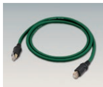
HS-LINK Kabel AHDL-15