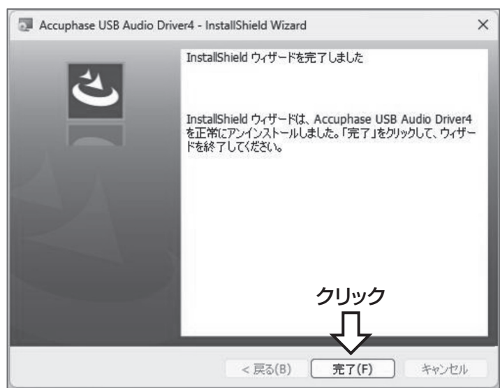
図8. アンインストール完了