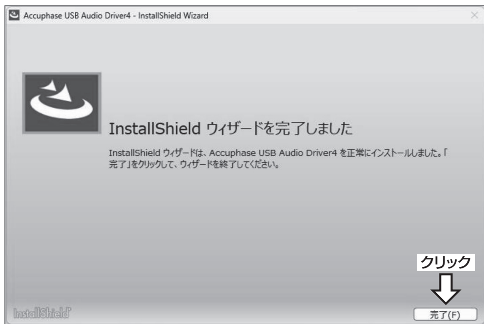
図3. USB ドライバー・インストール完了画面