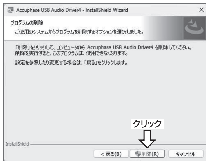
図7. アンインストールの最終確認画面