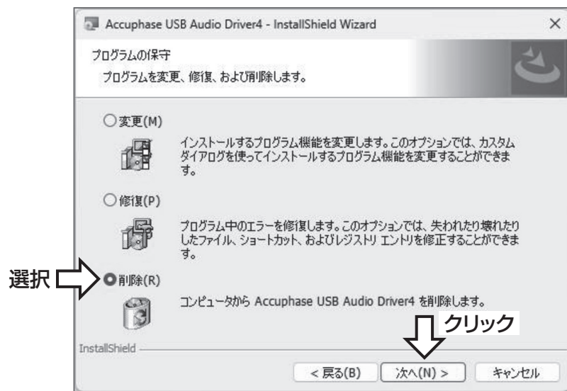
図6. 変更／修復／削除選択画面