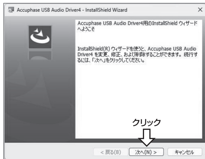
図5. プログラムの変更