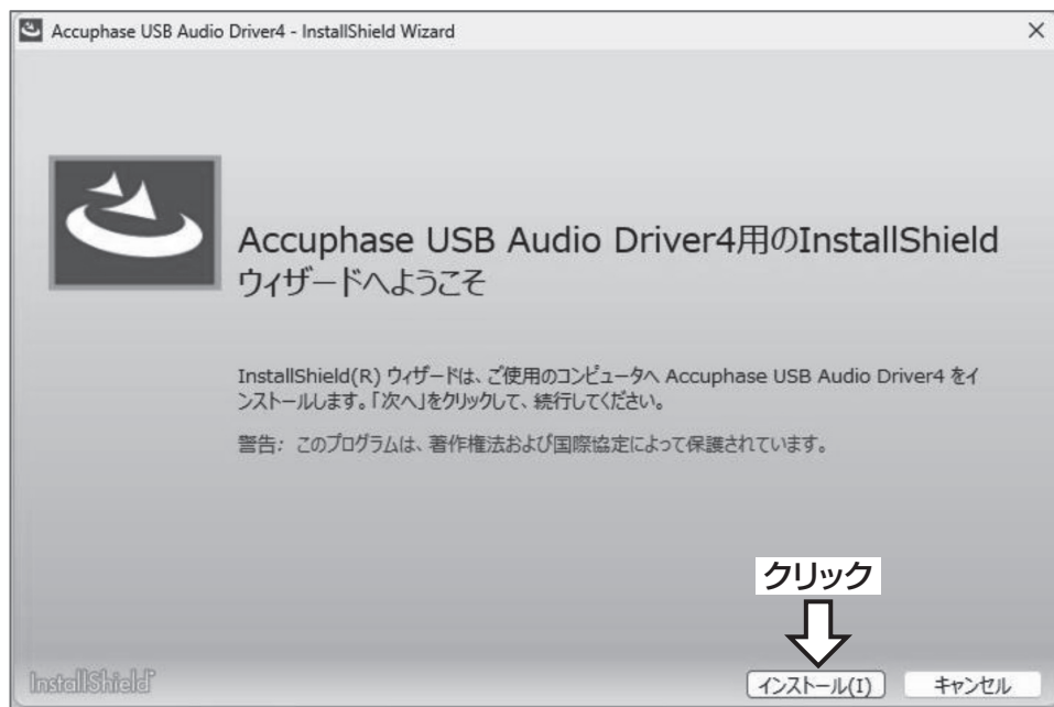
図2. USB ドライバー・インストール確認画面